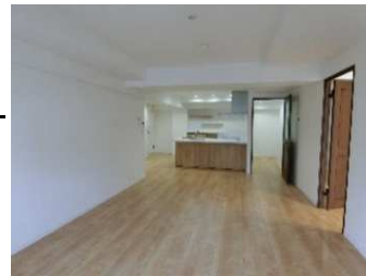
1リビングダイニング ↓洗面台 ↓浴室