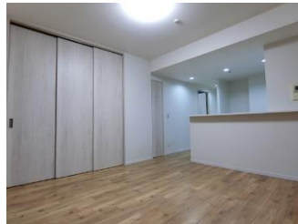
↑リビングダイニング