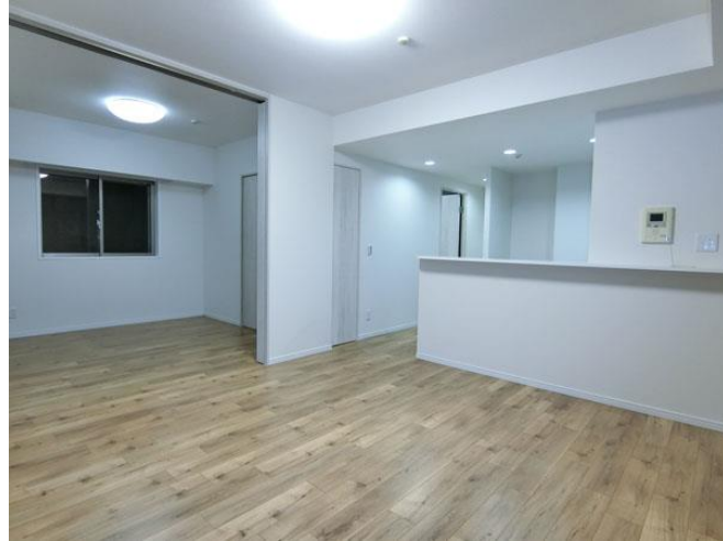
↑リビングダイニング