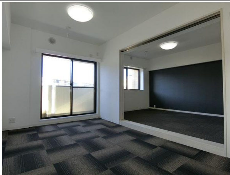
↑リビングダイニング～洋室1