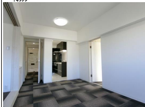
↑リビングダイニング