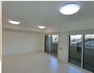
↑リビングダイニング