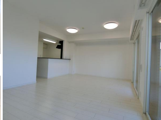
↑リビングダイニング