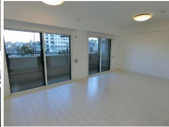
↑リビングダイニング