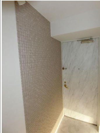
↑玄関(エコカラット)